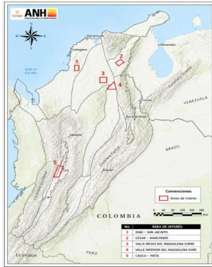
Figura 1. Áreas propuestas (polígonos rojos) para la ubicación de los pozos estratigráficos.

Para tener una mayor contextualización de las áreas priorizadas por la ANH para la realización de los pozos, la Tabla 1. presenta a continuación la información general clave asociada a cada una: